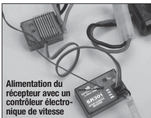
Alimentation du récepteur avec un contrôleur électronique de vitesse