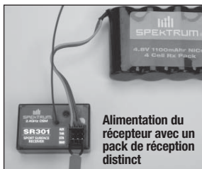
Alimentation du récepteur avec un pack de réception distinct